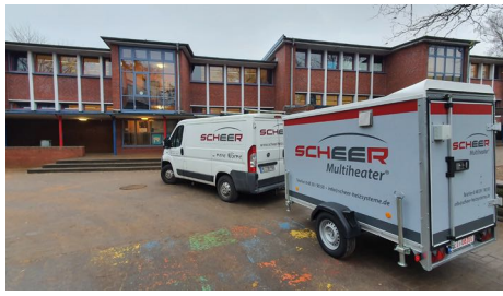
Schule am Kiefernberg