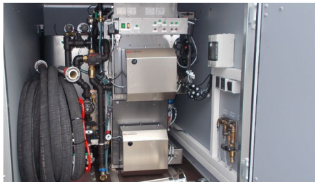
Beste Redundanz mit zwei integrierten 70 kW Heizsystemen