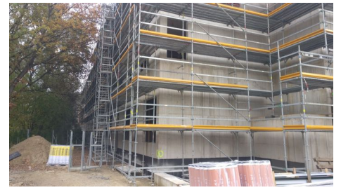
Stadteilschule Stübhofer Weg