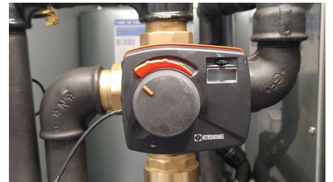
Mischer kann auf jeden beliebigen Wert ab 20 °C für den Vorlauf eingestellt werden