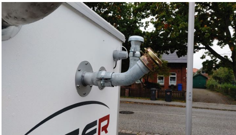
Einfache Befüllung von außen