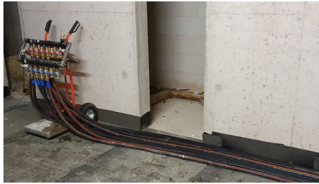
Anwendungsbeispiel des Verteilers