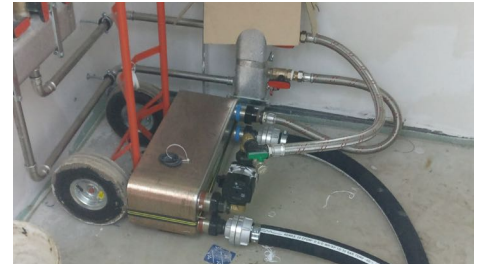
Plattenwärmetauscher zur Systemtrennung